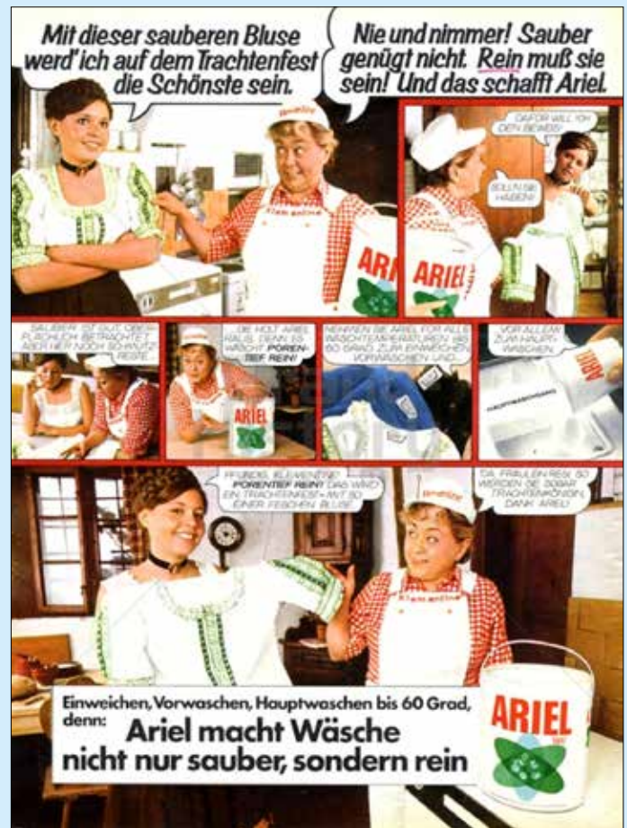
Die absolute Reinheit, „nicht nur sauber, sondern rein“, versprach die Werbefigur Klementine 1973 in einer Waschmittelwerbung

Im Verlauf des 18. Jahrhunderts kam es in der Aufklärungsmedizin zu einer Neubewertung der Haut, die nun als Organ des Ein- und Ausatmens betrachtet wurde. Die Hautoberfläche sollte daher mit Wasser reingehalten werden. Das aufstrebende Bürgertum betrachtete den Körper als Arbeitsinstrument, das leistungsfähig