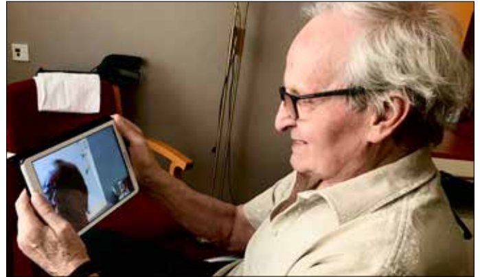
Das Bild zeigt einen Bewohner beim Videochat mit seiner Frau.