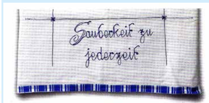
Zierhandtücher frühes 20. Jahrhundert, aus der Sammlung des Fränkischen Freilandmuseums Fladungen