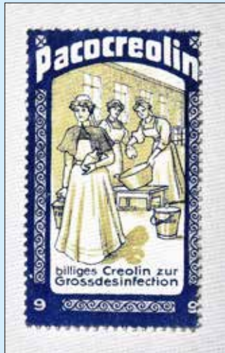
Werbemarke für das Desinfektionsmittel Pacocreolin, um 1900, Foto Deutsches Medizinhistorisches Museum Ingolstadt

sein. Mit hohem Zeit-, Kraft- und Chemieeinsatz wurde am hochartificialen Ideal der „reinen“, vor Sauberkeit glänzenden Wohnung gearbeitet.