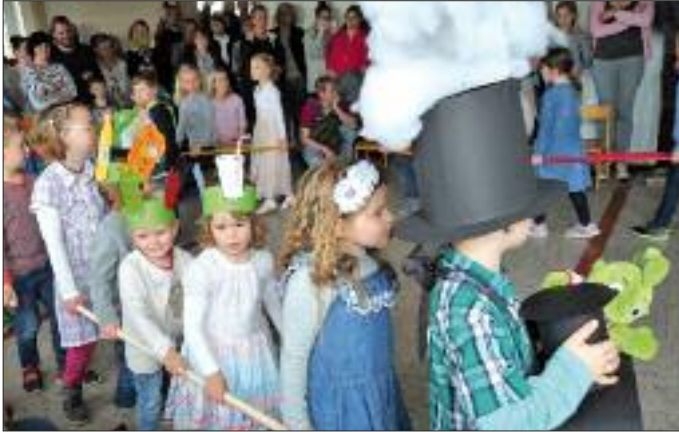
Die Kinder stellten die Ernährungspyramide in Form eines bunten Drachenzug dar