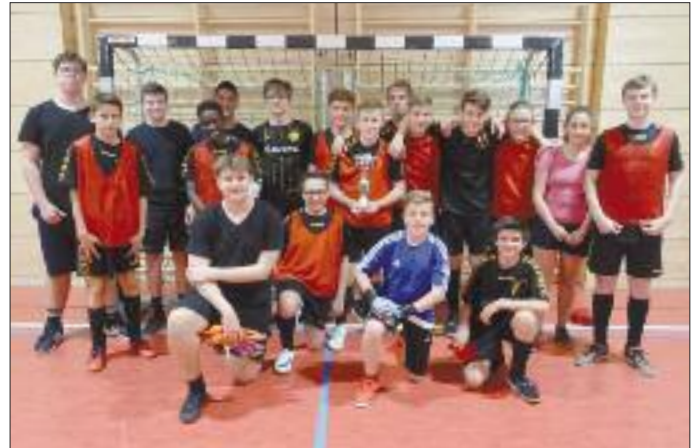
Sieger der Klassen 8-10

CADOLZBURG - Die Cadolzbürger Schulmeisterschaften im Fußball fanden Anfang April statt. An zwei Tagen ermittelten die Mittelschüler ihre Meister 2019. Wie in den letzten Jahren spielten Teams der Dillenbergschule und der Mittelschule Langenzenn-Veitsbronn mit. Eine schöne Tradition!