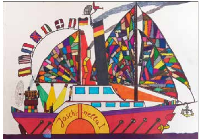
Kinderbild 1973