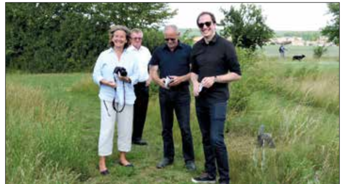
Am Siebenerplatz in Langenzenn

Die virtuelle Ausstellung über die Feldgeschworenen wird auf dem bayerischen Kulturportal www.bavarikon.de voraussichtlich ab Ende 2021 zu sehen sein.