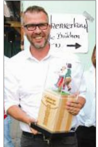
Der Kärwapokal wanderte nach Egersdorf

Am Samstag wurde wie immer zuerst der Kinderkärwabaum und dann der Baum der „Großen“ aufgestellt. Hier spielten