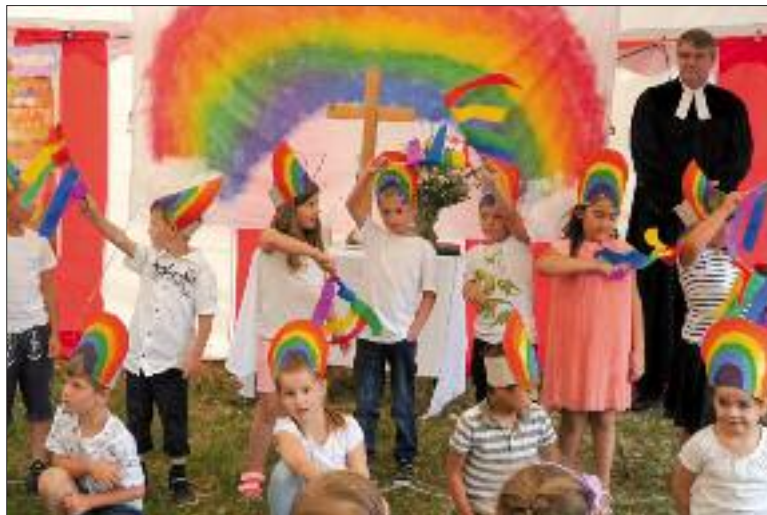
Die Tulipan-Kinder singen das Regenbogenlied und freuen sich über ihre neu gestaltete Kita.