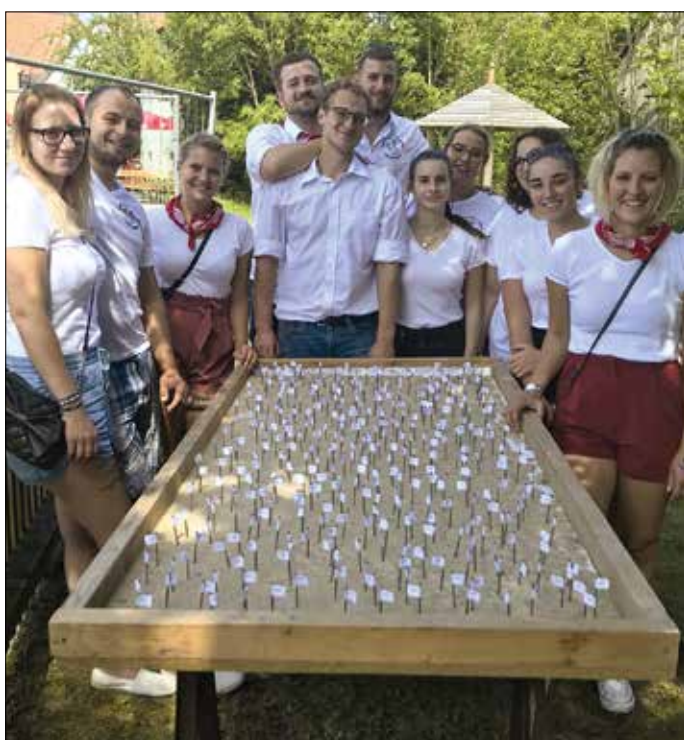
Die Vincenzenbronner Kärwaburschen und -madli mit ihrem Nagelbrett