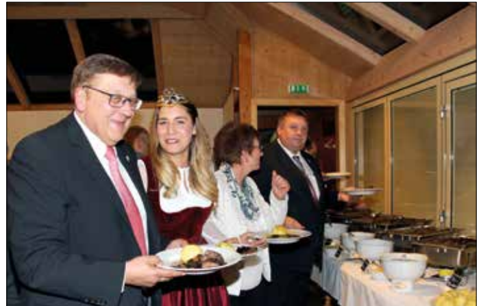
Wildbretwocheneröffnung in den Brennereistuben in Wilhelmsdorf

Ein kostenloses Faltblatt mit allen elf Gasthöfen, den angebotenen Wildgerichten und den Informationen zum Gewinnspiel ist bei