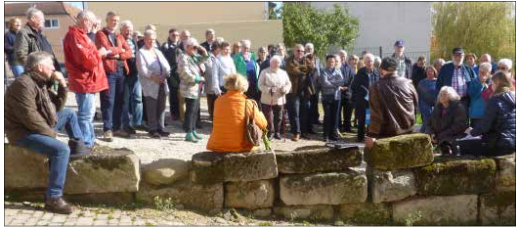
Foto der Teilnehmer in Wilhermsdorf

suchten Orten nicht gegeben. Nach dem Juden-Pogrom im November 1938 meldeten die Bürgermeister von Zirndorf, Wilhermsdorf und Langenzenn, dass ihre Orte jetzt judenfrei seien. Seitdem gibt es hier kein speziell jüdisches Leben mehr.