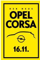
Beispielfoto der Baureihe. Ausstattungsmerkmale ggf. nicht Bestandteil des Angebots.